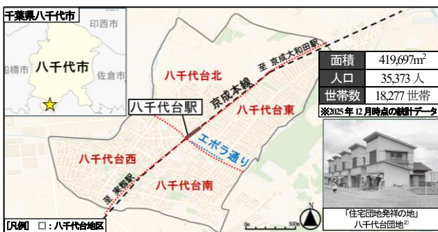
図 1 研究対象地域図（八千代台地区）