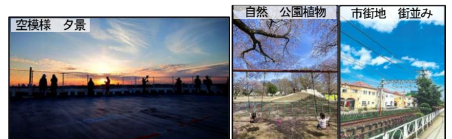
写真 13 2024 年最優秀作品

[凡例] □：本文記載事項、●：空模様、●：自然、●：市街地、●：動体物、●：社会基盤、●：文化教育、●：その他、□：代表写真の撮影地